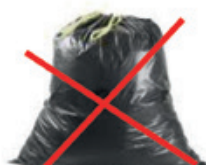
SAC FERMÉ = NON