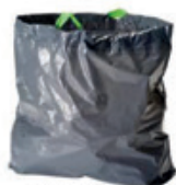
SAC OUVERT = OUI