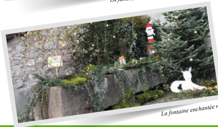
La fontaine enchantée n°3

Il en résulte un embellissement du village, mais surtout un rapprochement humain qui est fort réjouissant car au-delà du travail réalisé pour la décoration, des hommes, des femmes et des enfants ont mis en commun leur savoir-faire, leurs idées. Des visiteurs sont venus se promener dans le village pour contempler ces magnifiques réalisations.