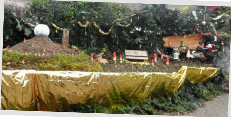
Les lutins n°7