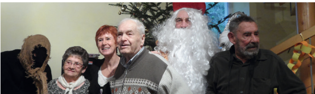
Les aînés du village