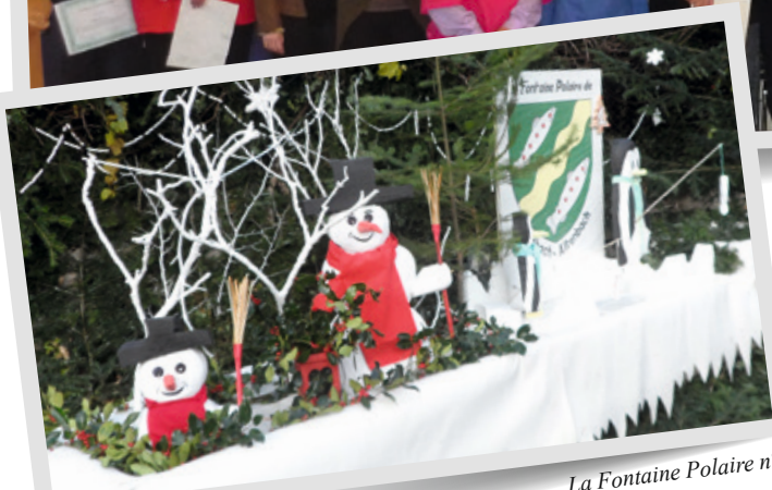
La Fontaine Polaire n°1