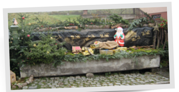
La fontaine d'or n°6