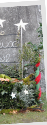
La crèche n°2