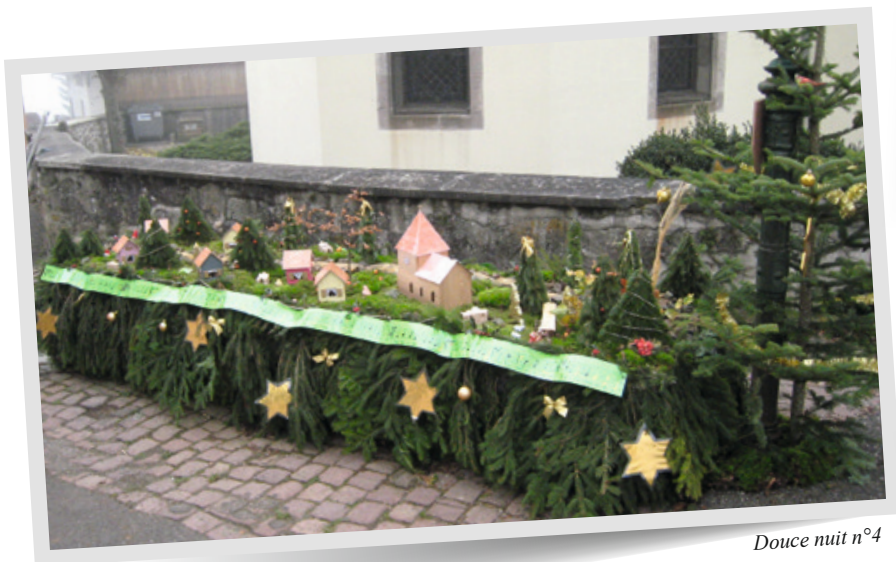
Douce nuit n°4