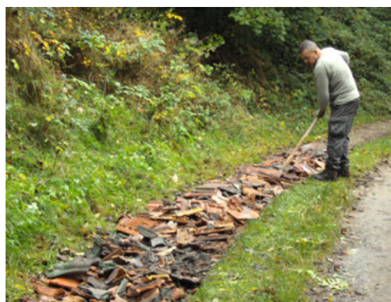
Chemin du Brafy