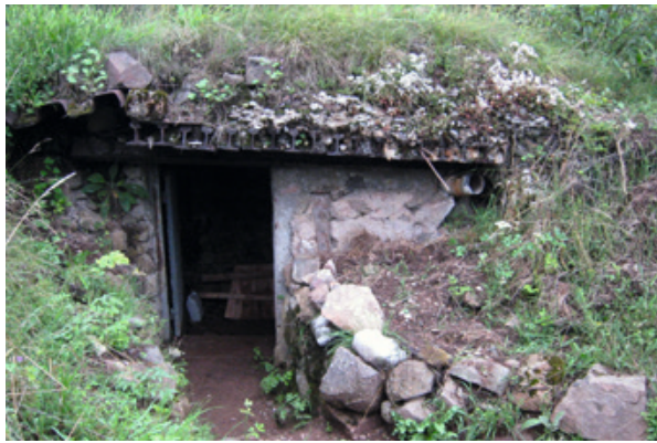
Un abri de guerre

Le Hartmannswillerkopf a été un lieu de combat très actif. Culminant à 956 mètres d'altitude, le Hartmannswillerkopf est apparu comme une position stratégique du sud des Vosges dès décembre 1914, tour à tour, conquis par les troupes françaises et allemandes. Les combats ne cessèrent pas jusqu'à novembre 1918, les plus importants ayant lieu en 1915. La spécificité du terrain et du climat à cette altitude oblige les troupes à développer des techniques propres à la guerre de montagne. Il est intéressant de noter la proximité des lignes allemandes et françaises. Au sommet, seulement